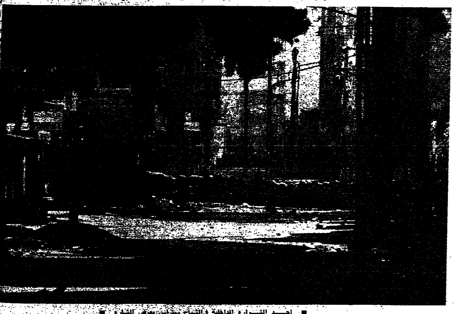
احد الشوارع الداخلية في الشاه بجانس بمرش الشارع